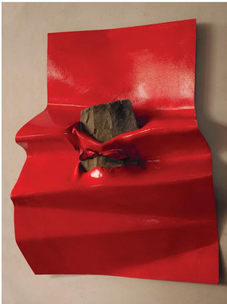
PAGINA 2021, PVC, smalto e pietra, cm 58x78x16