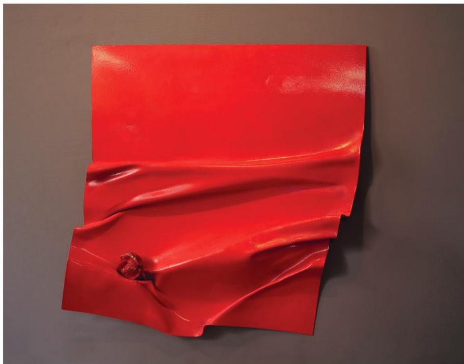
PAGINA 2022, PVC, smalto e ceramica, cm 107x104x13