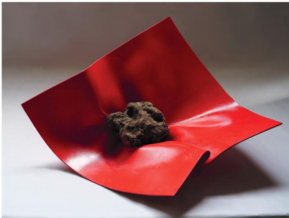
PESO LEGGERO 2023, PVC, smalto e radice, cm 48x37x28