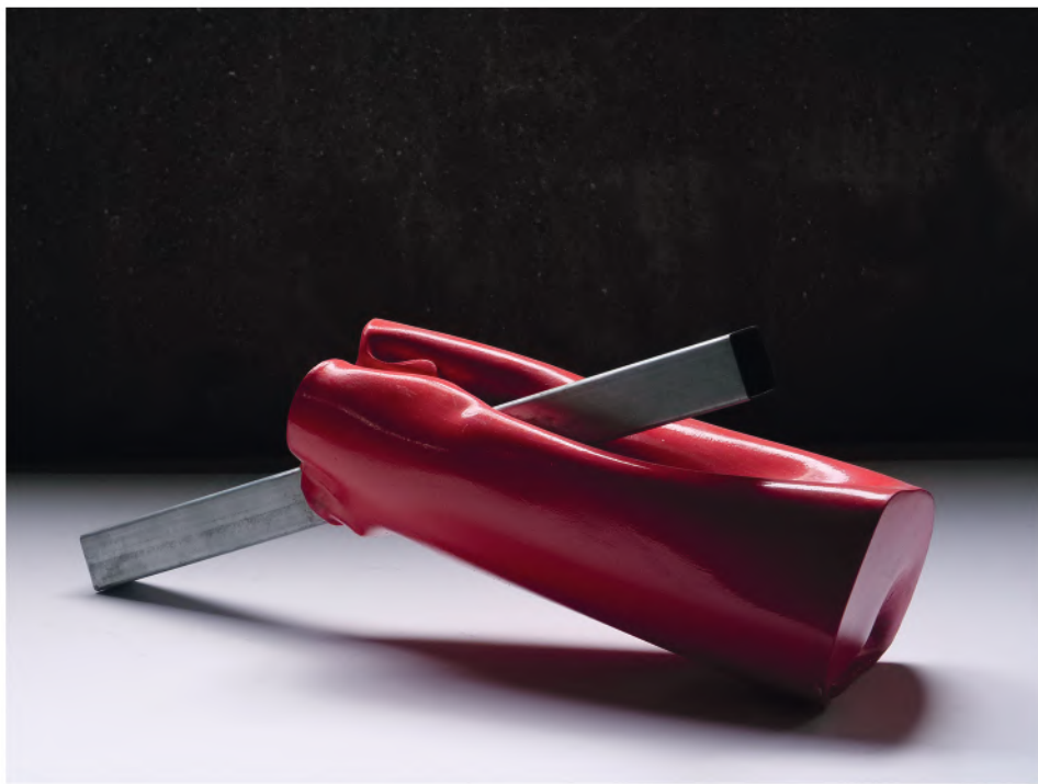
CROCE CADUTA 2020, PVC e acciaio, cm 21x68x40