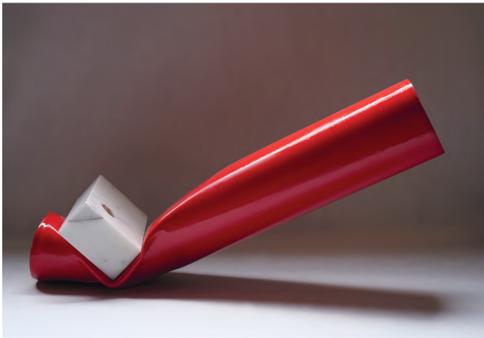
CONTRACCOLPO 2023, PVC, smalto e marmo bianco, cm 80x33x42