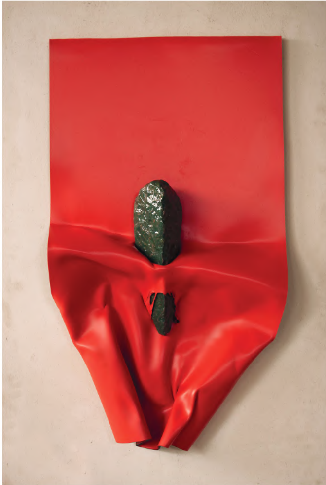
PAGINA 2021, PVC, smalto e ceramica, cm 49x88x11