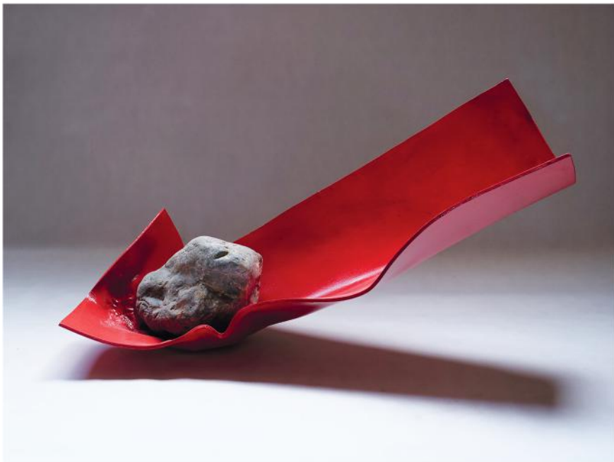
PESO LEGGERO 2023, PVC, smalto e pietra, cm 73x32x40