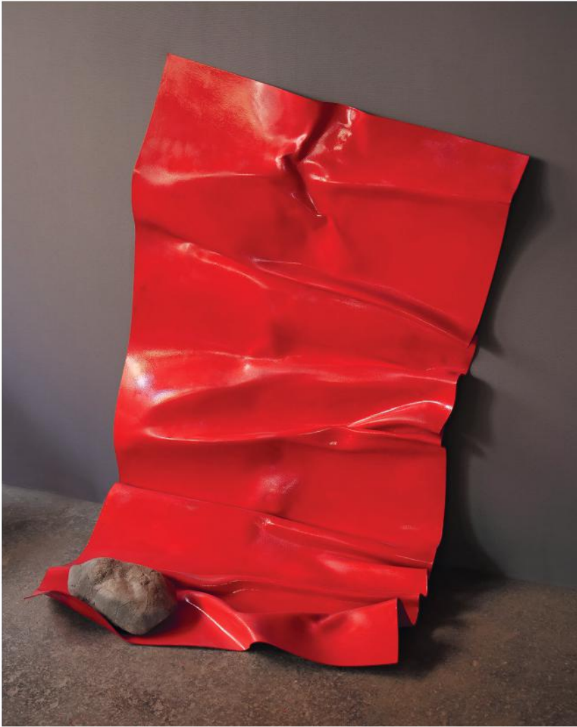
PAGINA CADUTA 2022, PVC, smalto e pietra, cm 102x132x87