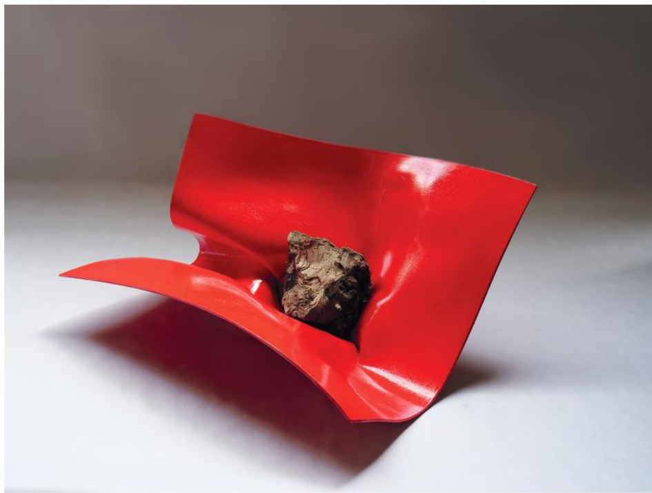
PESO LEGGERO 2023, PVC, smalto e radice, cm 48x38x24