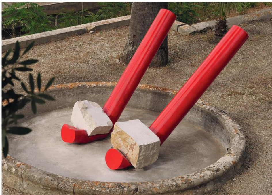
CONTRACCOLPI 2021, PVC, smalto e marmo perlinato di Sicilia, cm 300x70x170, (Fondazione Orestiadi - Gibellina)