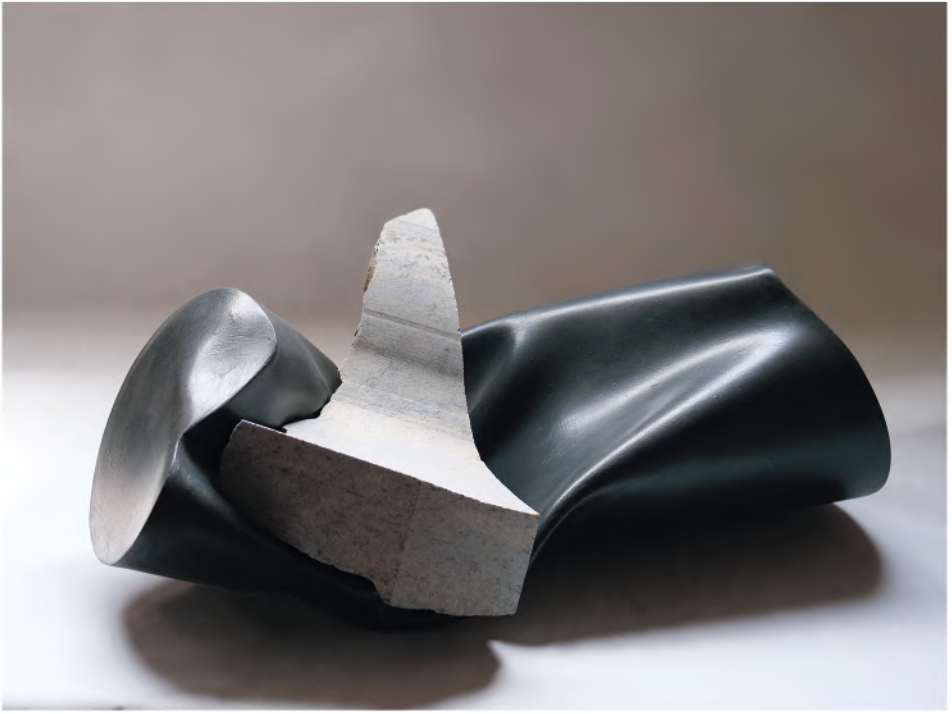
CONTRACCOLPO 2020, PVC, smalto e marmo del Brasile, cm 75x37x30