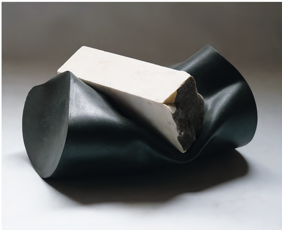
CONTRACCOLPO 2020, PVC, smalto e marmo bianco, cm 40x31x21