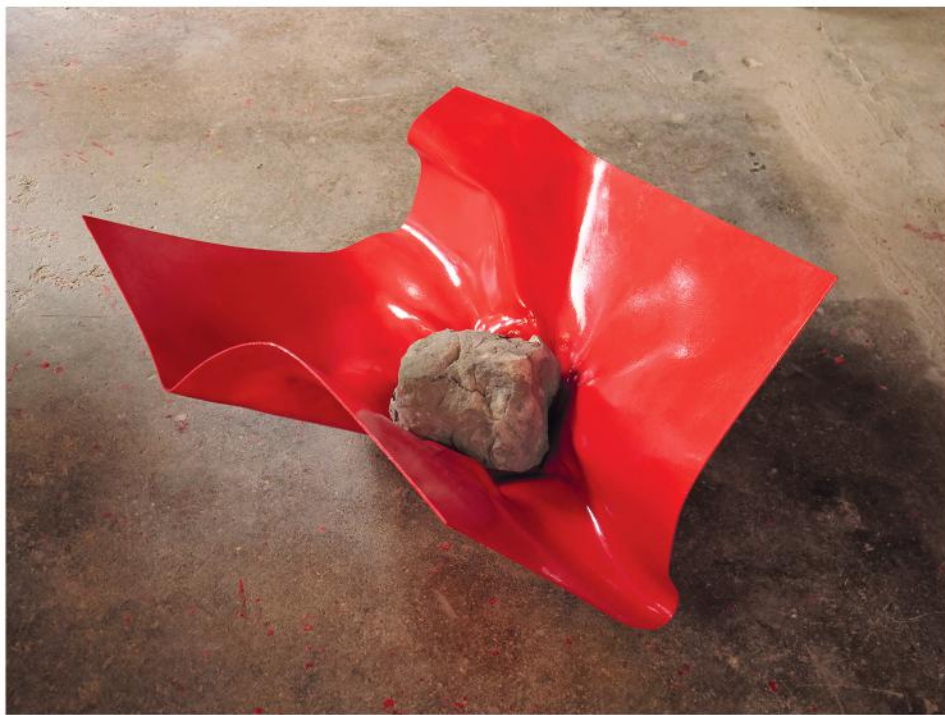
PESO LEGGERO 2022, PVC, smalto e pietra, cm 85x95x45