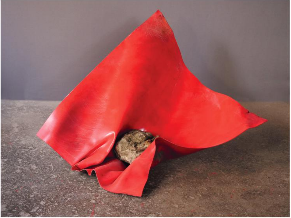
PESO LEGGERO 2023, PVC, smalto e pietra, cm 91x80x67