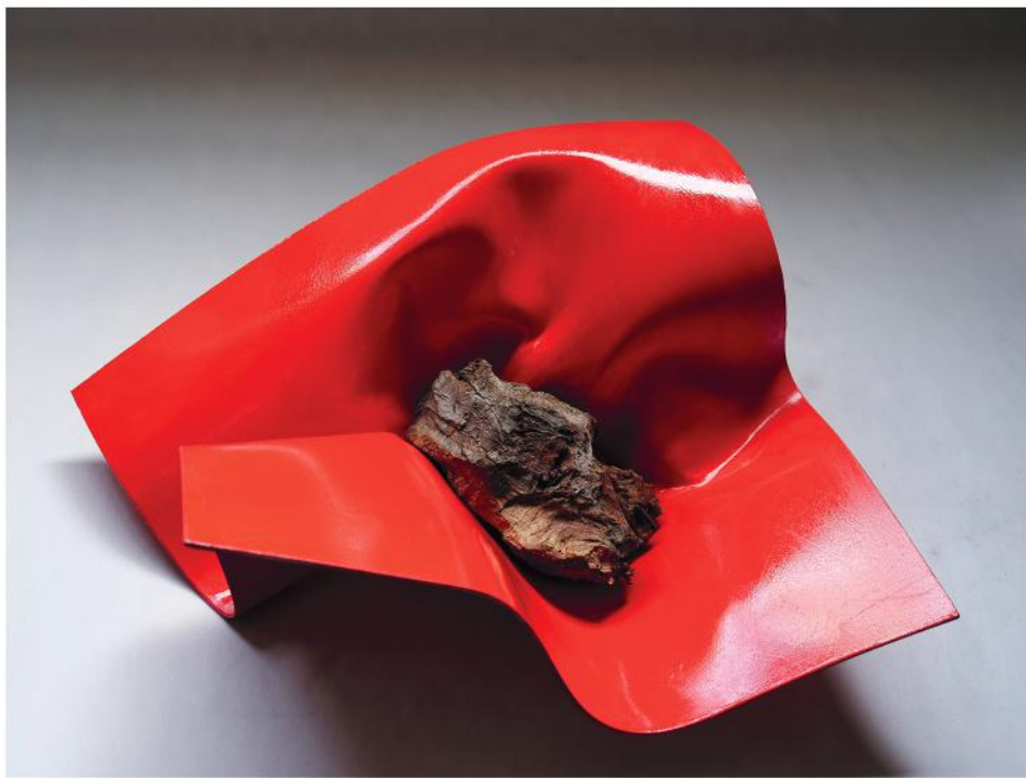
PESO LEGGERO 2023, PVC, smalto e radice, cm 42x49x18