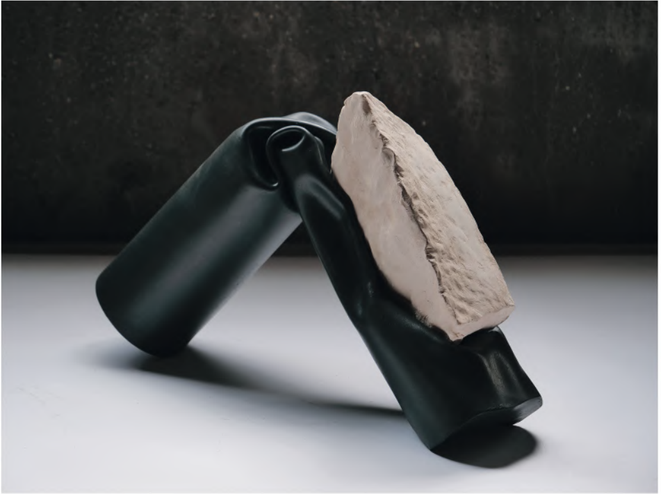
CONTRACCOLPO 2020, PVC e terracotta, cm 34x56x10